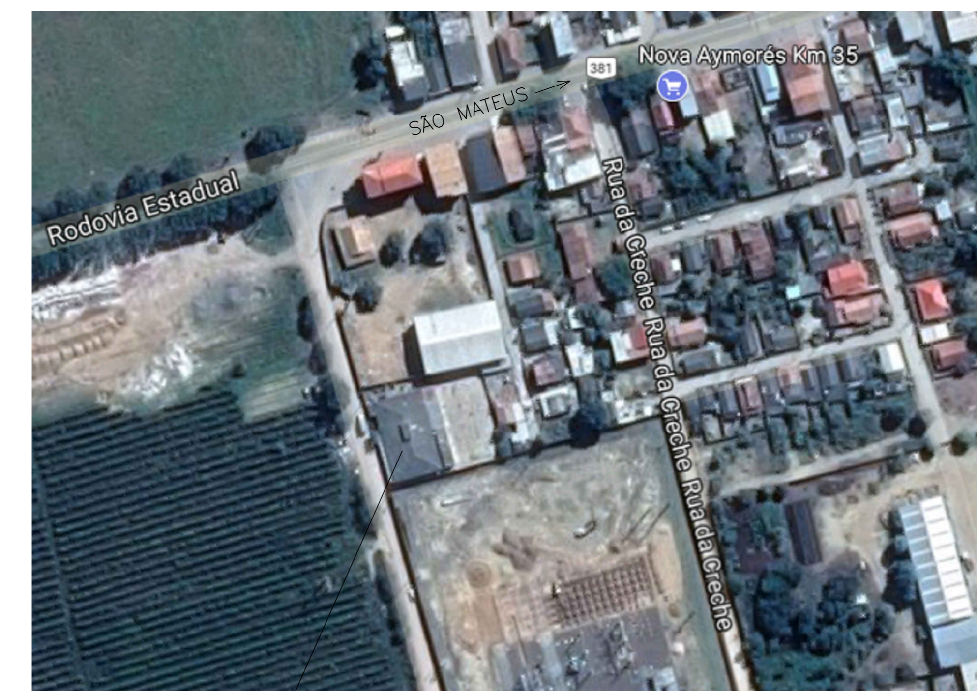
ESCOLA MUNICIPAL DE ENSINO FUNDAMENTAL Km 35